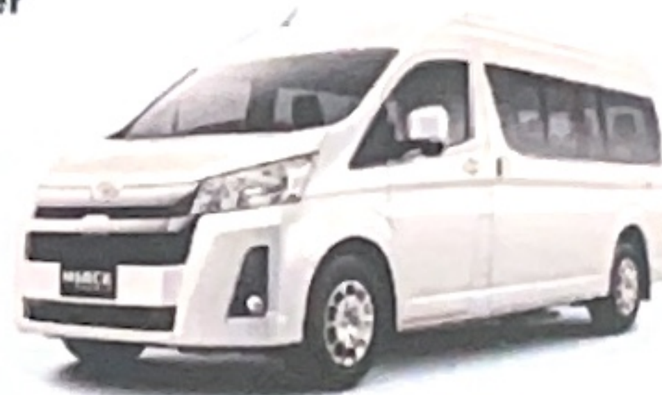
Hi Ace Premio