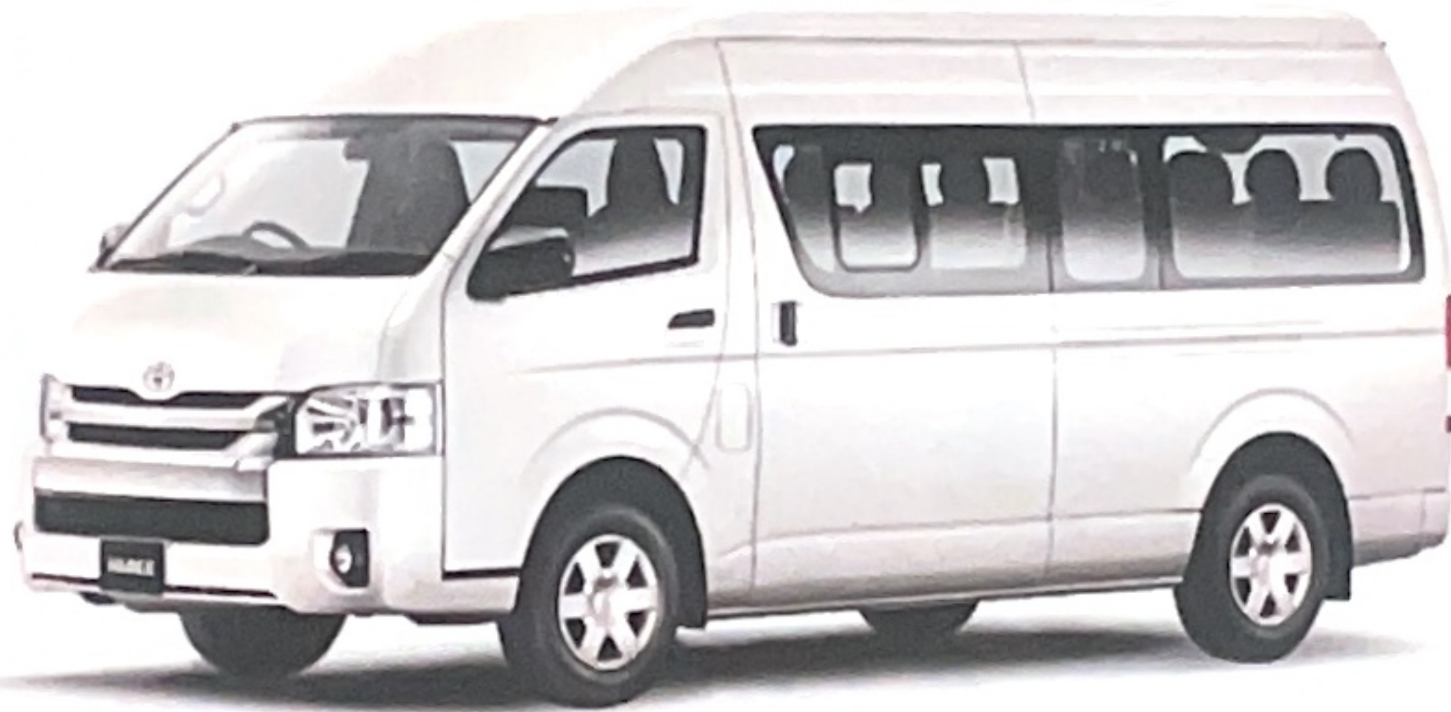
Hi Ace Commuter